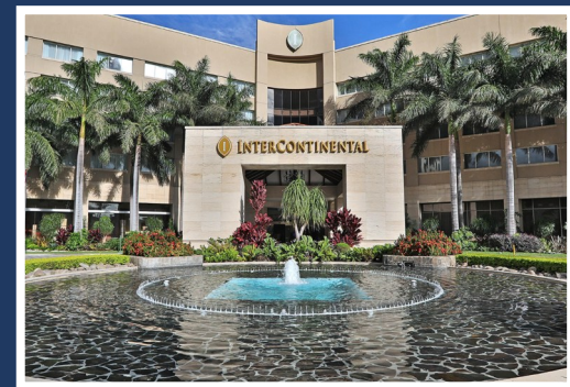
Hotel Intercontinental San José, Costa Rica

Intercontinental Hotel—San José, Costa Rica